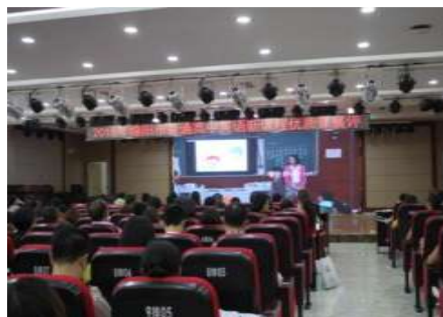
主讲教师课堂展示